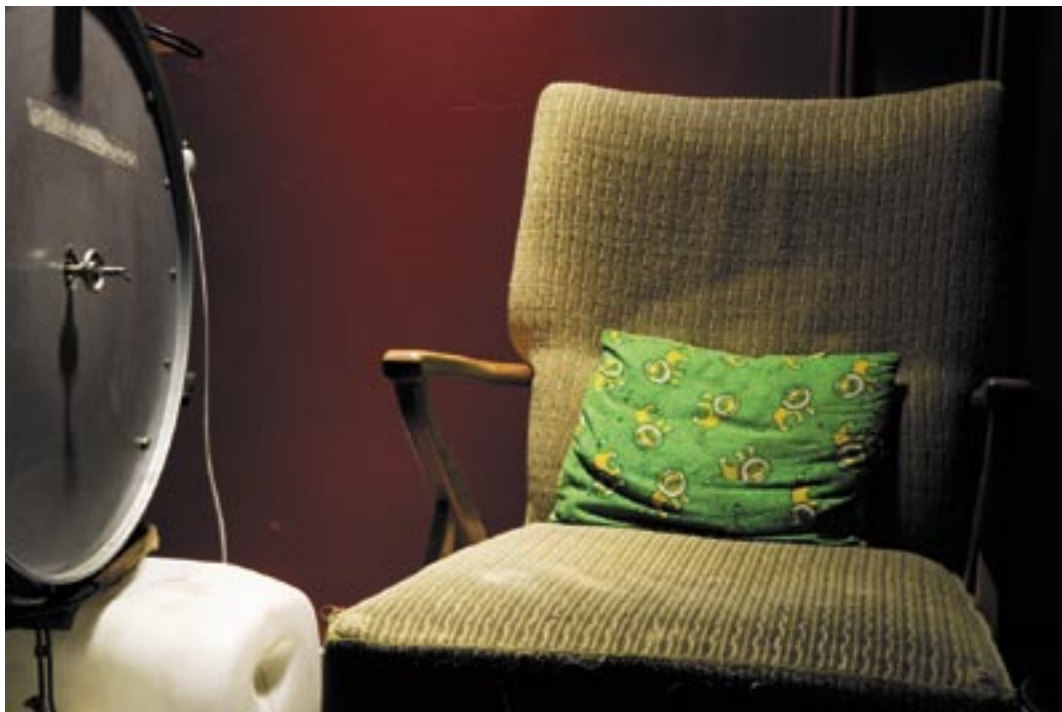
I maskinrum 1 på Hagbion kan maskinisten Kasper Knaptun njuta mellan visningarna.